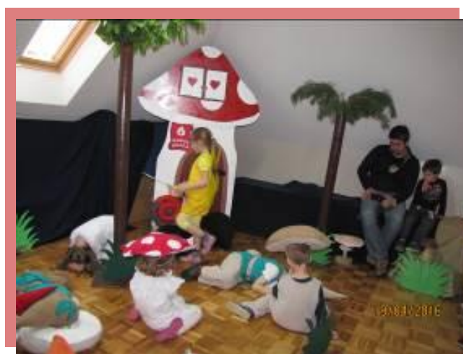
fotografije št. 5, 6 in 7: dramatizacija za starše