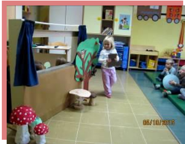
fotografija št. 1: Lutkovna predstava VNŠ za najmlajše