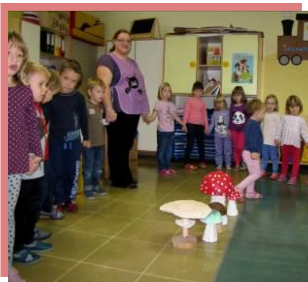
fotografija št. 2: Rajanje ob gobicah