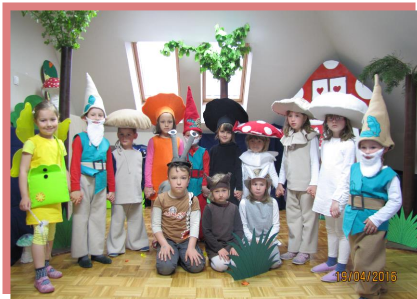
fotografija št. 4: mladi dramski igralci