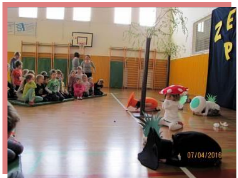
fotografija št. 3: Dramatizacija zgodbe VNŠ za šolarje