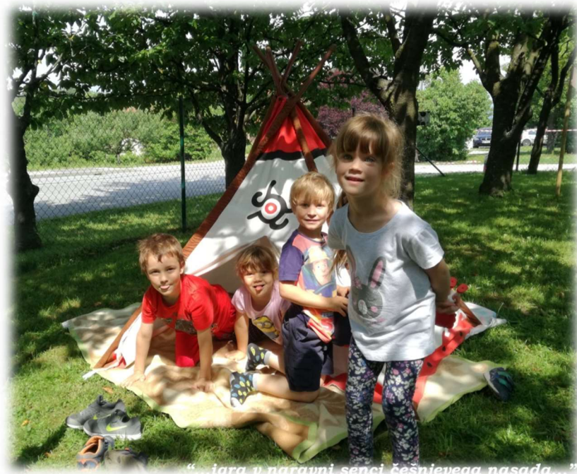
"...igra v naravni senci česnjevega nasada..."