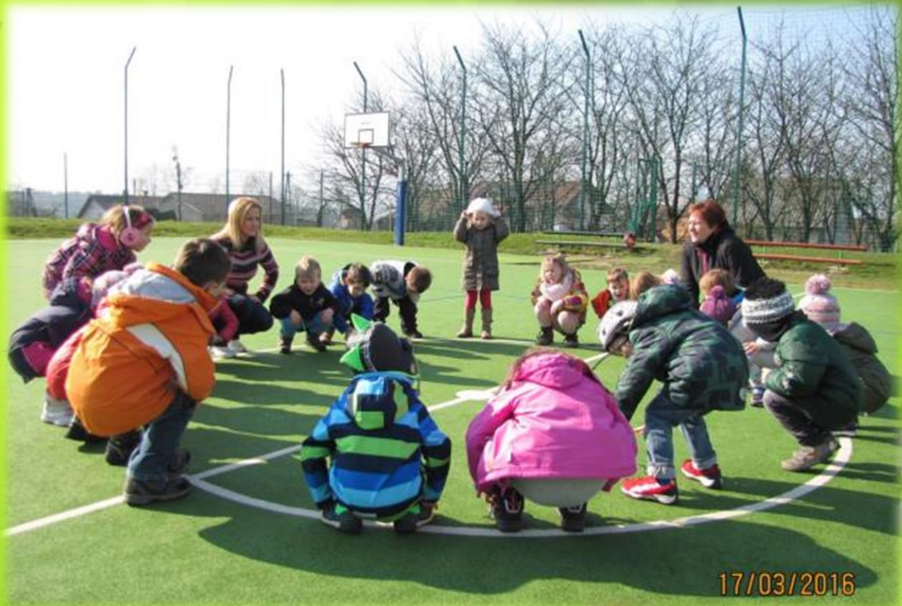
Igra na igrišču