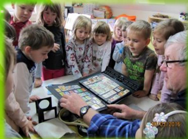
"Neličin dedek nam je predstavil svoj hobi - zbiranje poštinih znamk."