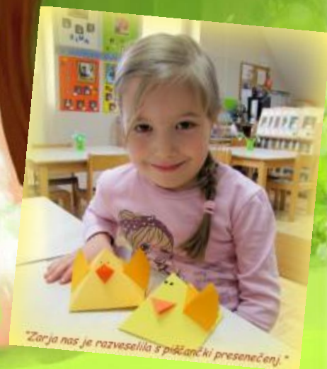
"Zarja nas je razveselila s piščančki presenečenj."

Zarja je bila ustvarjalna doma, v vrtcu pa nas je razveselila s piščančki, ki jih je izdelala.