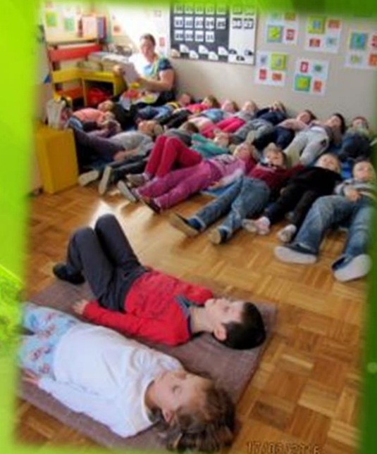
Sladkanje in počitek...