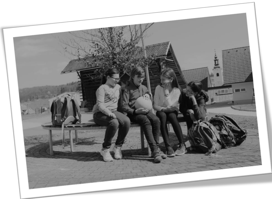
Prislunimo učenki s posebnimi potrebami