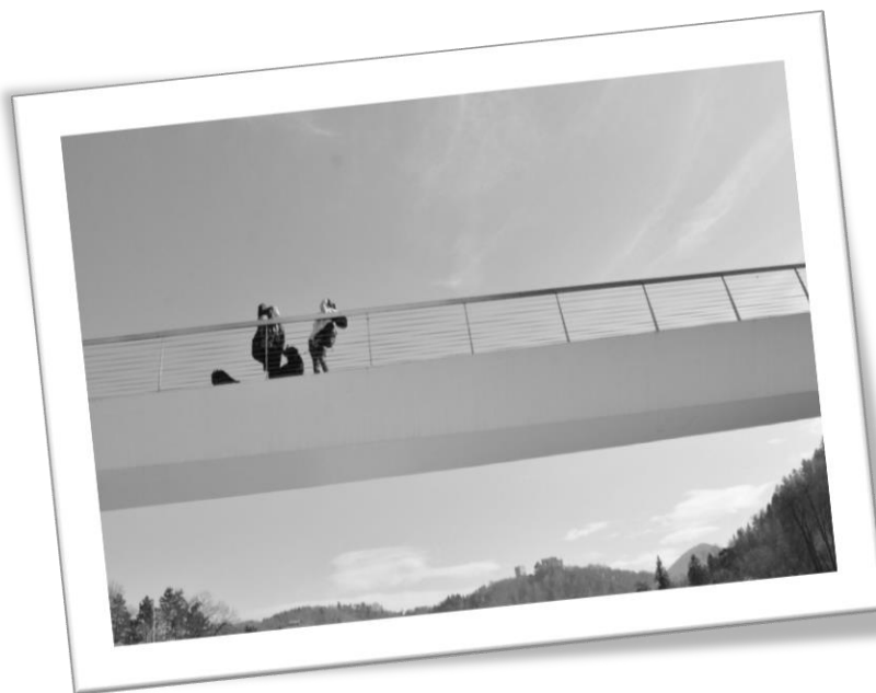
Prijateljstvo - zaupanje