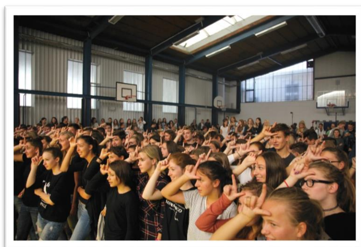
Krst prvošolcev