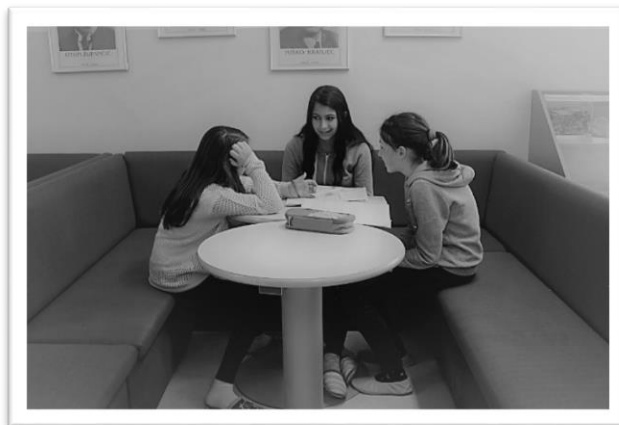
Pomoč sošolki