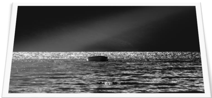
V samoti jutra