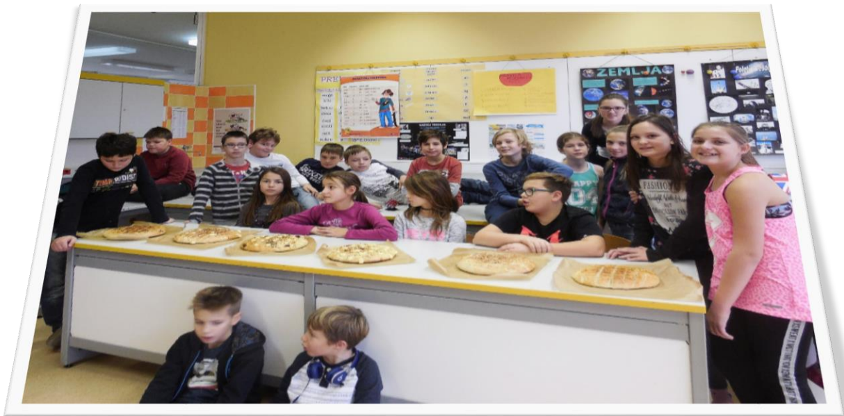
Belokranjska pogača