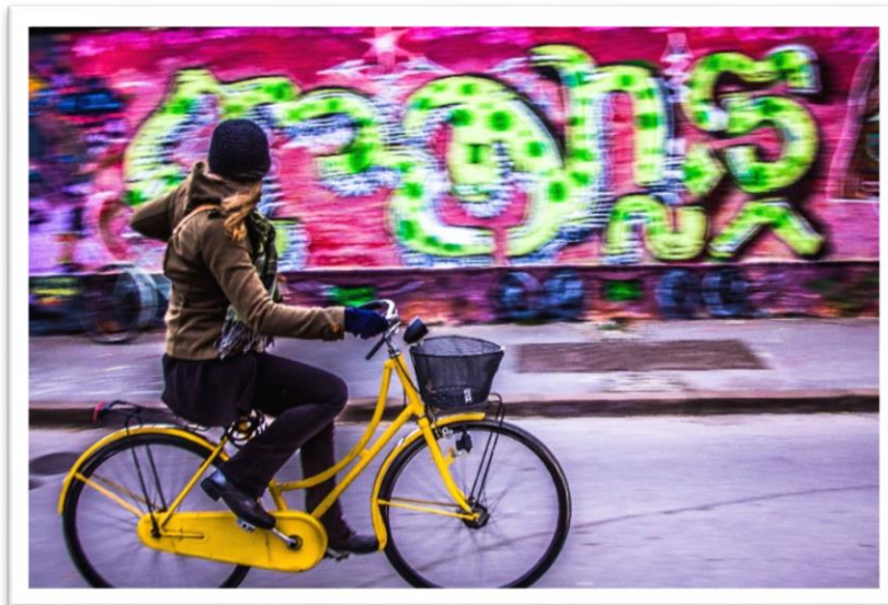
Barvni kontrast v gibanju