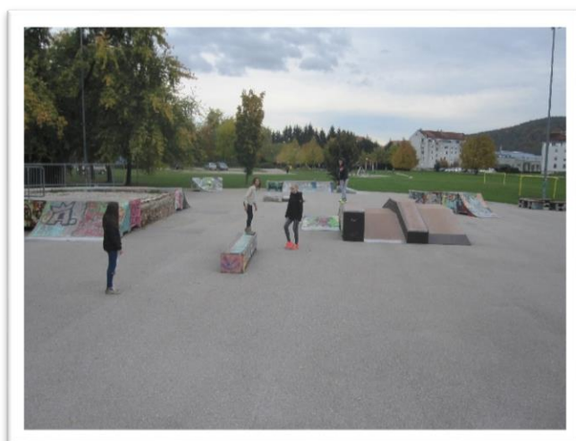
Skate park