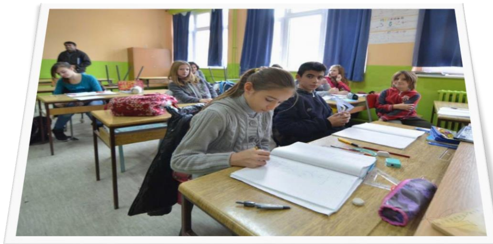
(Nove učilnice)