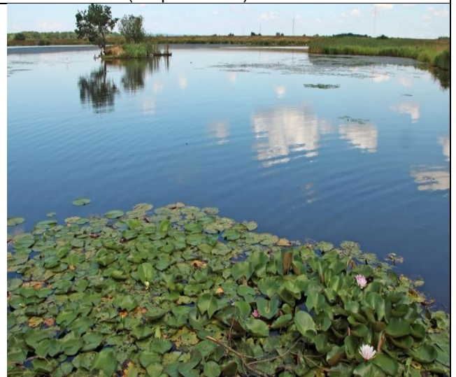
Beli lokvanj ( Nymphaea alba )