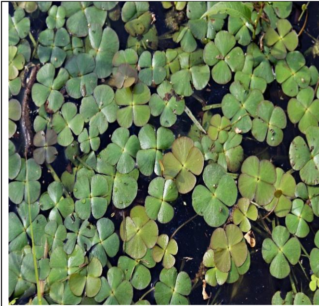
Štitiperesna marzilka ( Marsilea quadrifolia )