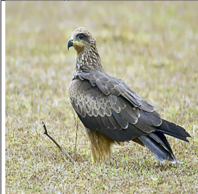
Črni škarnik ( Milvus migrans )