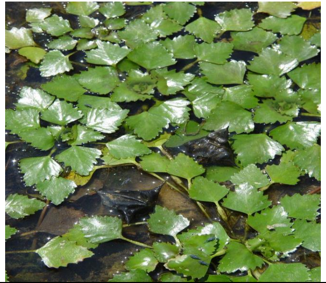
Vodni orešek ( Trapa natans )