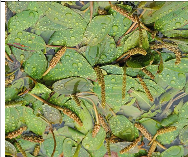
Plavajoči dristavec ( Potamogeton natans )