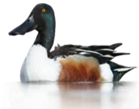
Žlicarica ( Anas clypeata )