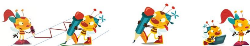
URNIK 1.razreda – šolsko leto 2020/2021