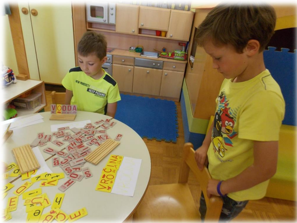
Sestavljanje besed na temo Varno s soncem.