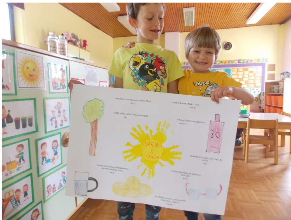
Skupno oblikovanje plakata z izjavami otrok.

Otrok spozna, da na njegovo zdravje vpliva okolje in tudi sam.