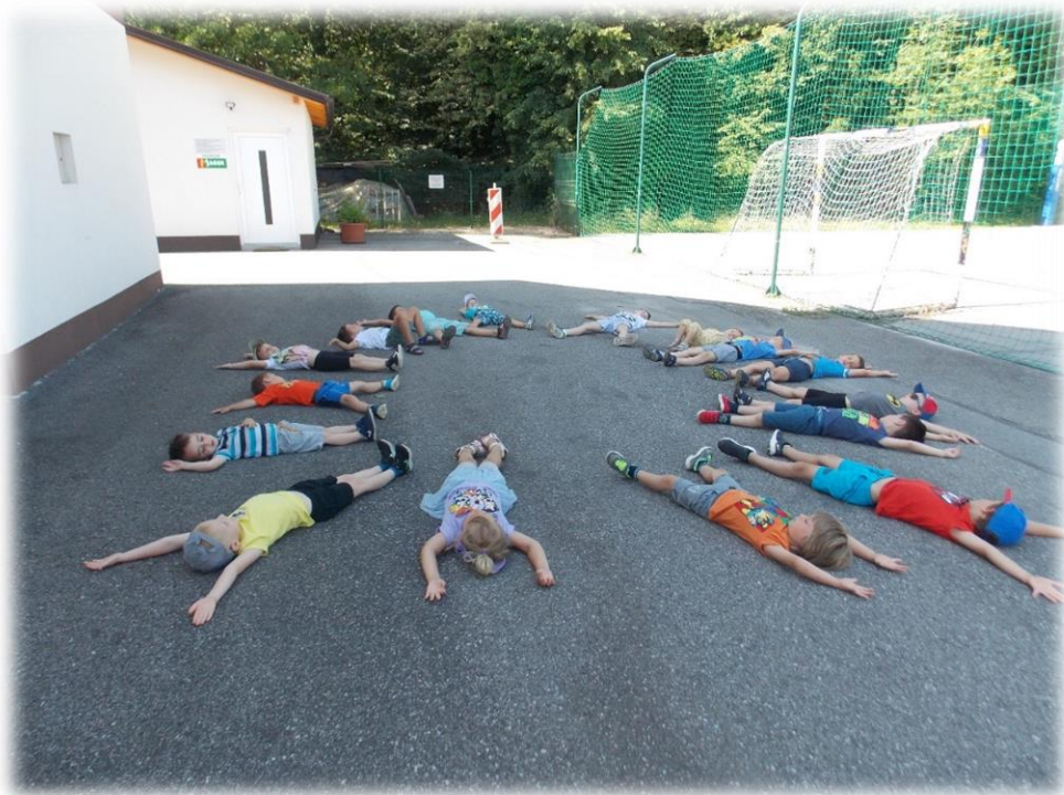
Igre sprostitve v naravni senci. Sestavimo formacijo sonca.