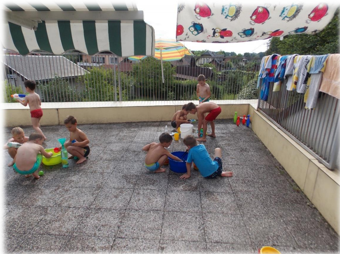
Igre z vodo.