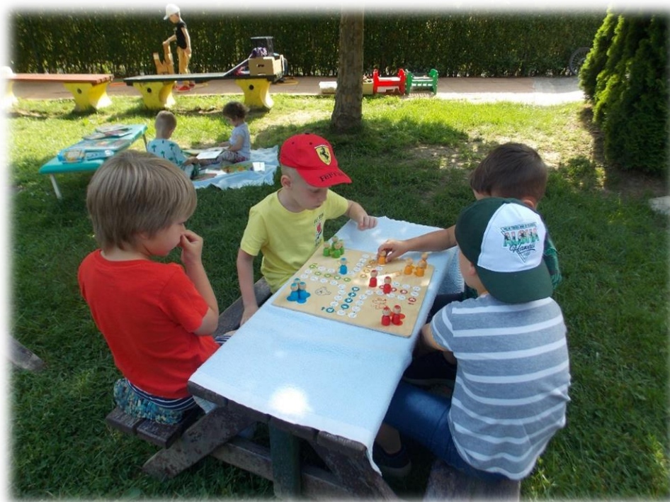
Gibanje na prostem ob uporabi osvojenih znanj znotraj projekta.

Otroke in starše seznaniti z načini zaščite pred škodljivimi vplivi sonca (primerna oblačila, pokrivala, zaščitna krema, ...).