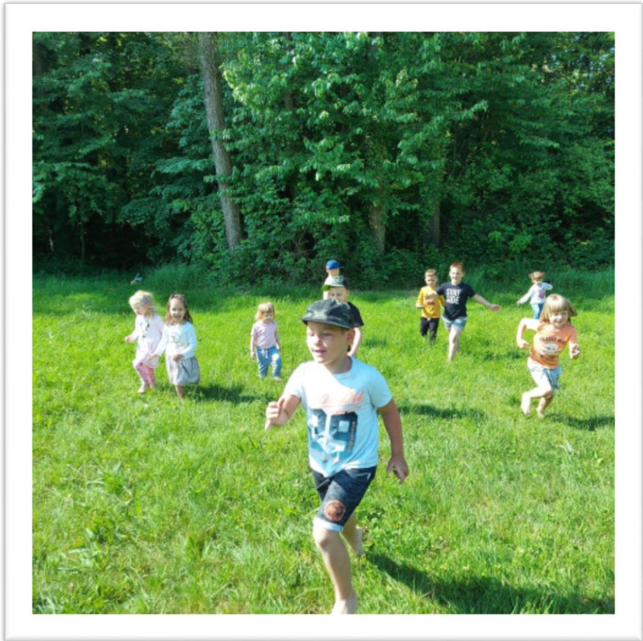
Bosih nog, naokrog.