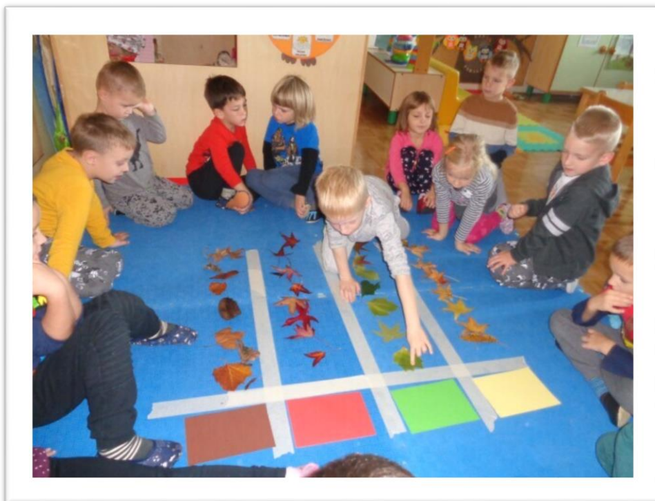
Ko delček gozda prinesemo v igralnico