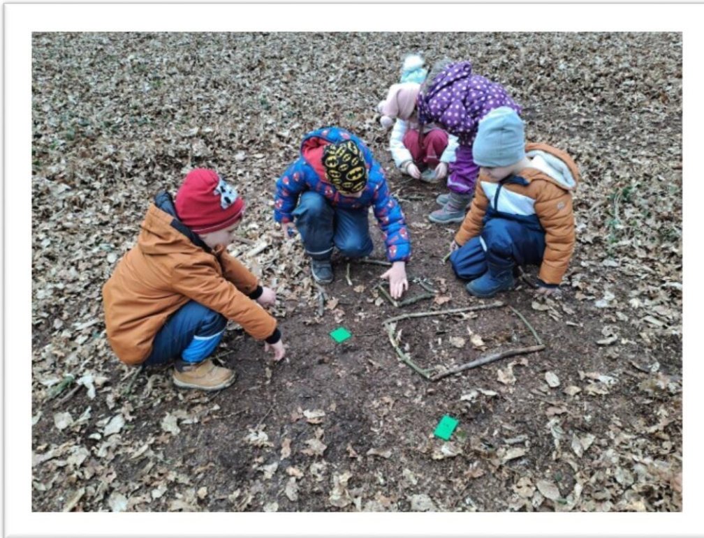
Polaganje oblik z gozdnim materialom