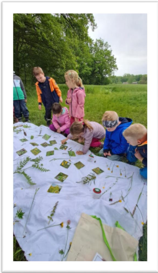
Kaj vse se najde!