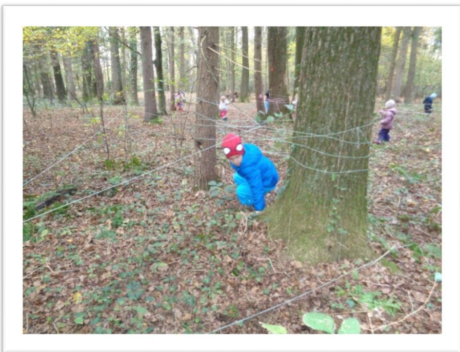
Pletemo mreže, učimo se prostorskih predlogov.