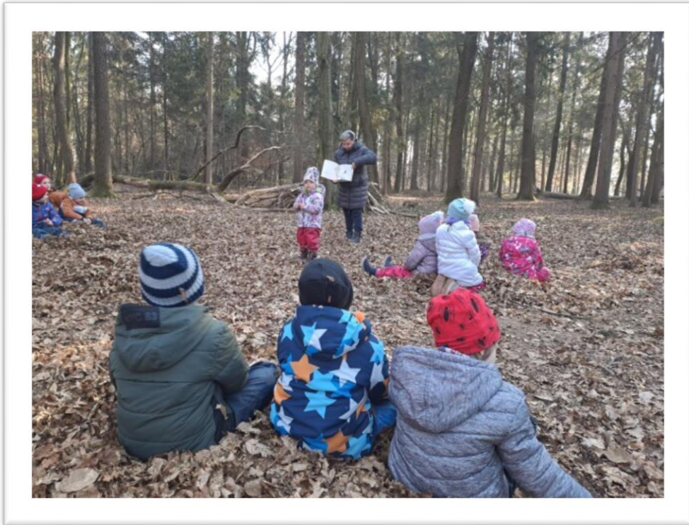
Poslušanje pravljice na mehki gozdni odeji.