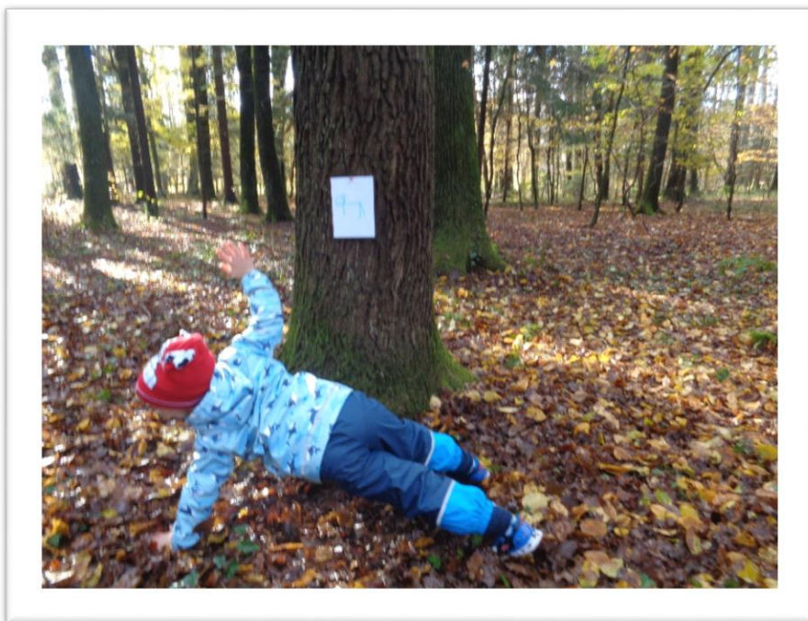
Igramo se igro »gozdni gibalčki«