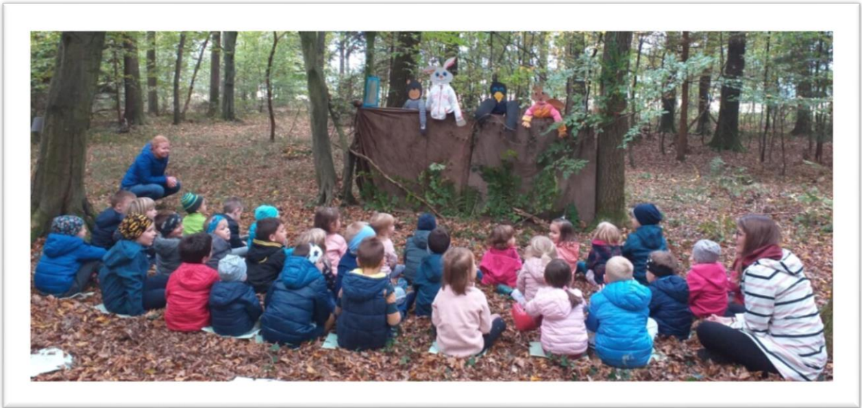
Lutkovna igra Zrcalce v našem gozdnem gledališču