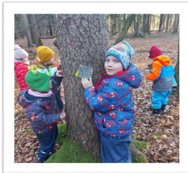
Gozdni detektivi na delu